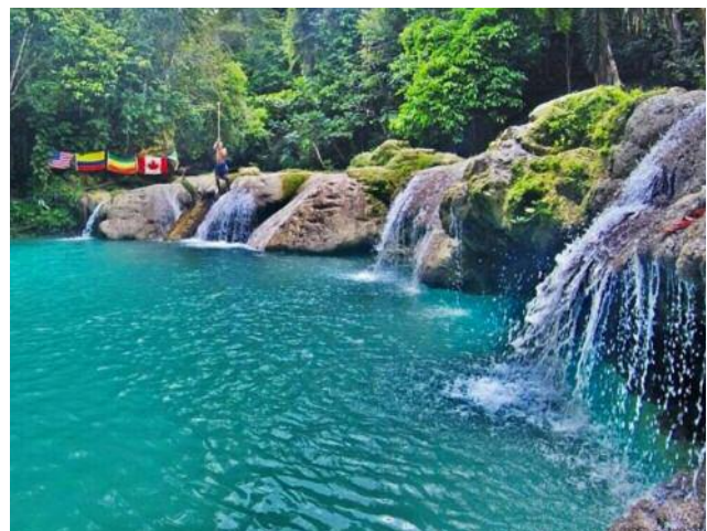
Hier können Sie den „Wasserfall im Dschungel“ erklimmen.