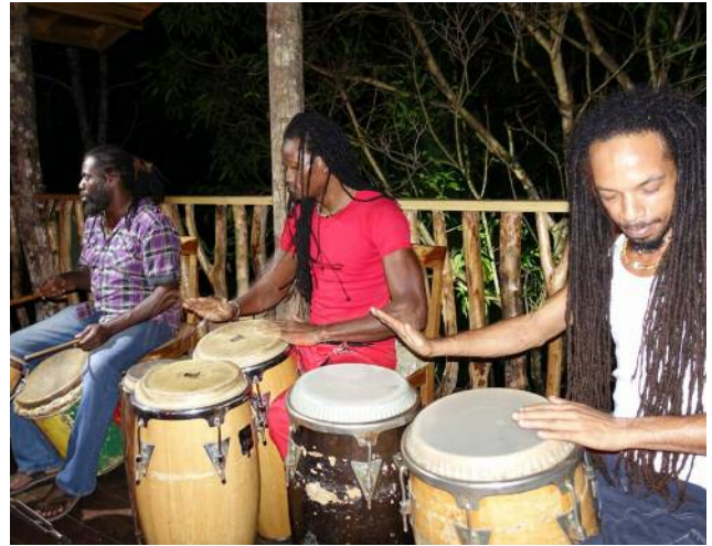
Die Lodge bietet kreativen Raum und ist perfekt für Inspiration.

kurse angeboten. Ob zum relaxen, Natur erleben oder zum wandern im Tropenwald. Hier können Sie das echte Jamaika entdecken und sich im Spa verwöhnen lassen. ( Ü, Lodge in den Canaan Mountains )