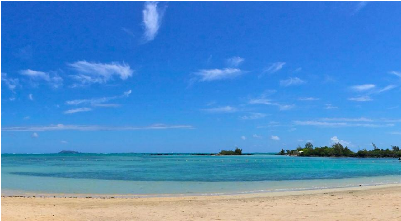
Jamaika Entdecker- und Insider-Rundreise. Reggae-feeling - abseits der üblichen Touristenziele.

3.Tag: Ocho Rios - Port Antonio. Heute geht die Fahrt zuerst in das Landesinnere zur Sun Valley-Plantage. Während einer kleinen Wanderung können Sie hier auf der Plantage, die verschiedenen Frucht- und Gemüsesorten von Jamaika kennenlernen. Weiter geht die Fahrt über Annotto Bay, Buff Bay nach Port Antonio.