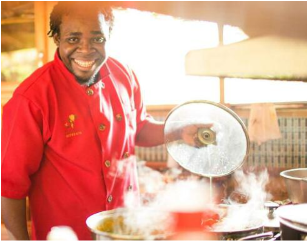
Aus dem Garten direkt auf den Tisch. Immer frisch und lecker.