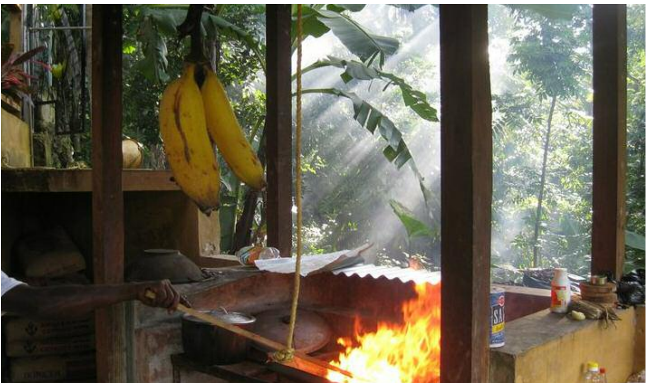
Die Lodge ist mehr als nur ein Rückzugsort vom Alltag. Es ist auch ein Ort, um die Rastafari-Kultur kennenzulernen.

12. Tag: Buschwanderung zu Rasta Fire´s Camp. Heute machen Sie eine mittelschwere Wanderung durch den Busch zu Rasta Fires Camp. Ein Guide bringt Sie über den Fluss und durch die Berge direkt in die Vergangenheit. Unterwegs können Sie sich erfrischen und ihre Wasserflaschen mit dem Bergquell-Wasser auffüllen.