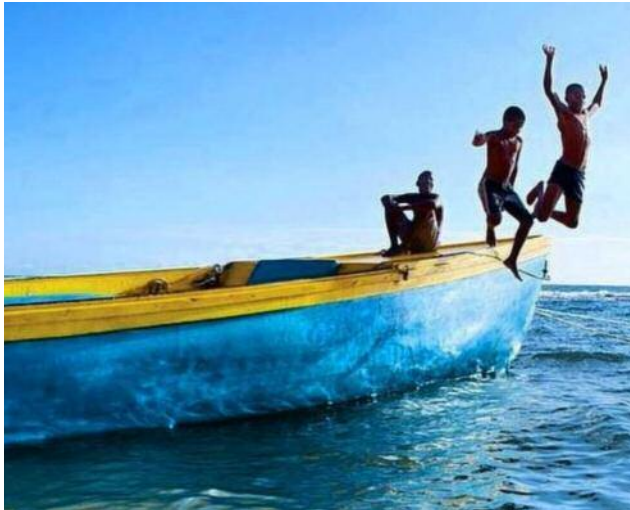
Karibik- und Reggae-feeling pur...

5. Tag: Kingston - Treasure Beach. Heute geht die Fahrt an die wilde und ursprüngliche Südküste von Jamaika. Sie fahren auf kleinen Landstraßen durch das schöne Landesinnere der Insel.