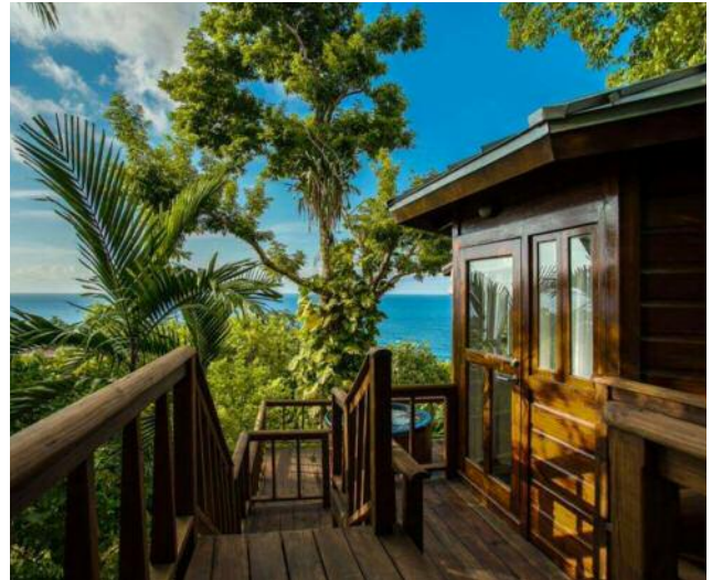
Das Meer und der nächste Strand ist auf Jamaika nie weit entfernt.

Weiter geht die Fahrt nach Kingston. In der lebendigen Hauptstadt gibt es einiges zu sehen. Reggae-Fans ist die Hauptstadt Jamaikas natürlich ein Begriff.