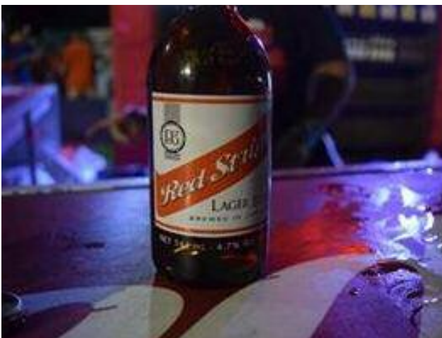
Passend zum naturnahen Konzept: lokale Küche und Lebensart

4. Tag: Port Antonio - Kingston. Am Vormittag können Sie (optional vor Ort buchbar) eine romantische Flossfahrt auf dem Rio Grande machen. Dabei können Sie Jamaika aus einer ganz anderen Perspektive erleben. Schon Errol Flynn hatte sich dieses Vergnügen gegönnt. Denn der Schauspieler und Darsteller in vielen Degenfil-