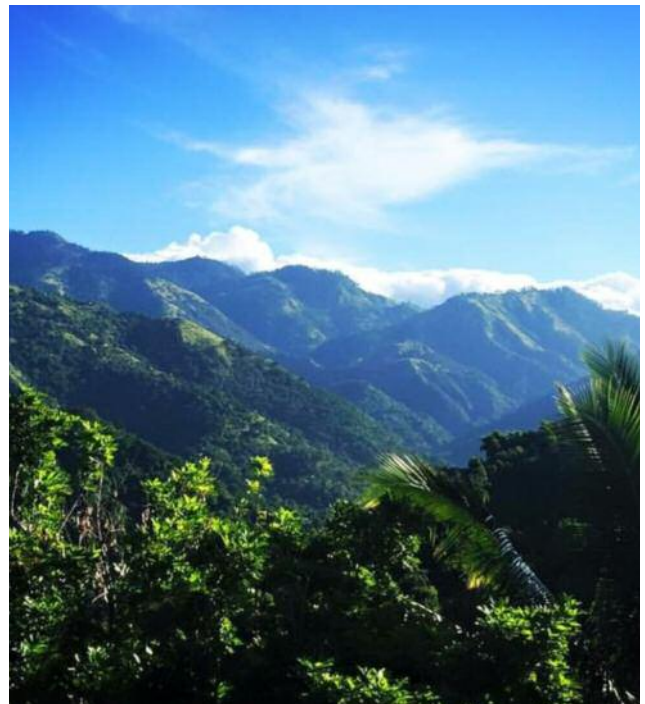
Das tropische Blue Mountains Gebirge im Osten von Jamaika.

Goldene Schallplatten, originale Bühnendekorationen, Tourneep plakate, Filme und Interviews lassen die Erinnerung an den Weltstar lebendig werden. Abendessen und Übernachtung ( Ü, Hotel in Kingston )