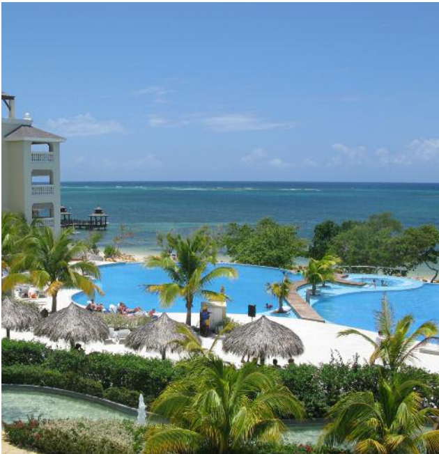
Hotel in Montego Bay

Genießen Sie die tropische Umgebung und lassen Sie Tag gemütlich, z.B. mit einem „Appleton White Rum“ ausklingen. Das Hotel liegt inmitten tropischer Vegetation, mit herrlichem Blick. Das Open-Air Restaurant bietet eine Auswahl an Speisen aus der internationalen und jamaikanischen Küche. Das Hotel verfügt über einen Swimmingpool mit Sonnenterrasse, eine Lobby Bar, sowie einen kleinen Supermarkt.