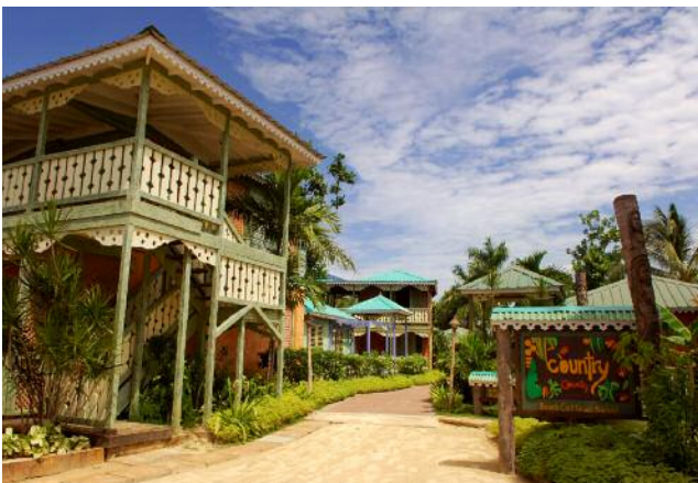
Die Cottages sind farbenfroh, mit natürlichen Materialien gestaltet.

Bei einem Besuch von Ricks Cafe, einer der bekanntesten Reggae-Bars der Karibik, können Sie den wagemutigen Klippenspringern zusehen. Ihre Unterkunft sind die Country Beach Cottages, die eingebettet in einen tropischen Garten, direkt am bekannten 7 mile Beach liegen.