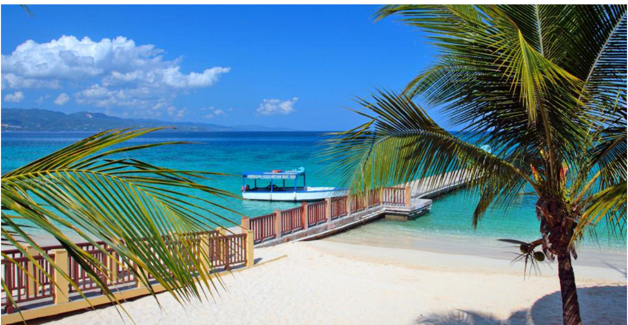
Hier am Doctors Cave Beach in Montego Bay können Sie sich perfekt von der Anreise erholen.

Hier im schönen Wasserfallpark können Sie sich herrlich erfrischen, baden und die Kaskaden hochklettern. In Ocho Rios bietet sich auch ein eigener Besuch der Coyaba Gardens mit dem kleinen Museum an, auch der Shaw Park Garden und die Harmony Hall Galerie sind empfehlenswert. Abendessen und Übernachtung. (Ü, Hotel in Ocho Rios )